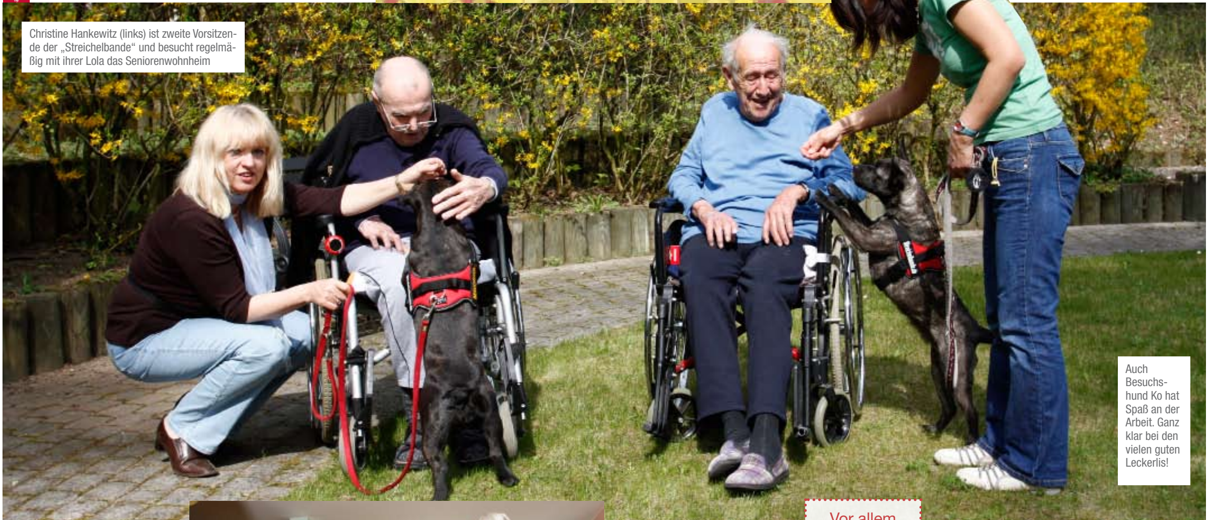
Auch Besuchshund Ko hat Spaß an der Arbeit. Ganz klar bei den vielen guten Leckerlis!

der Münchener Streichelbande. In gestellten Situationen wird so geprüft, wie der Hund auf außergewöhnliche Geräusche und Bewegungen reagiert, wie gut er auf sein Herrchen hört und ob er sich mit anderen Hunden versteht. Wichtig ist vor allem, dass die Besuchshunde ein ausgeglichenes, besonders menschenbezogenes Wesen haben und nicht etwa schreckhaft oder unsicher sind.